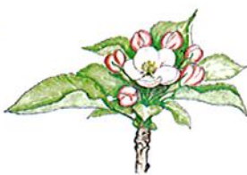
Applicazione Fioritura fase F (Inizio-piena fioritura)