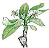
Applicazione Fine fioritura fase G-H (Caduta petali-allegagione)