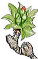
Applicazione Pre-fioritura fase E (Bottoni fiorali visibili)